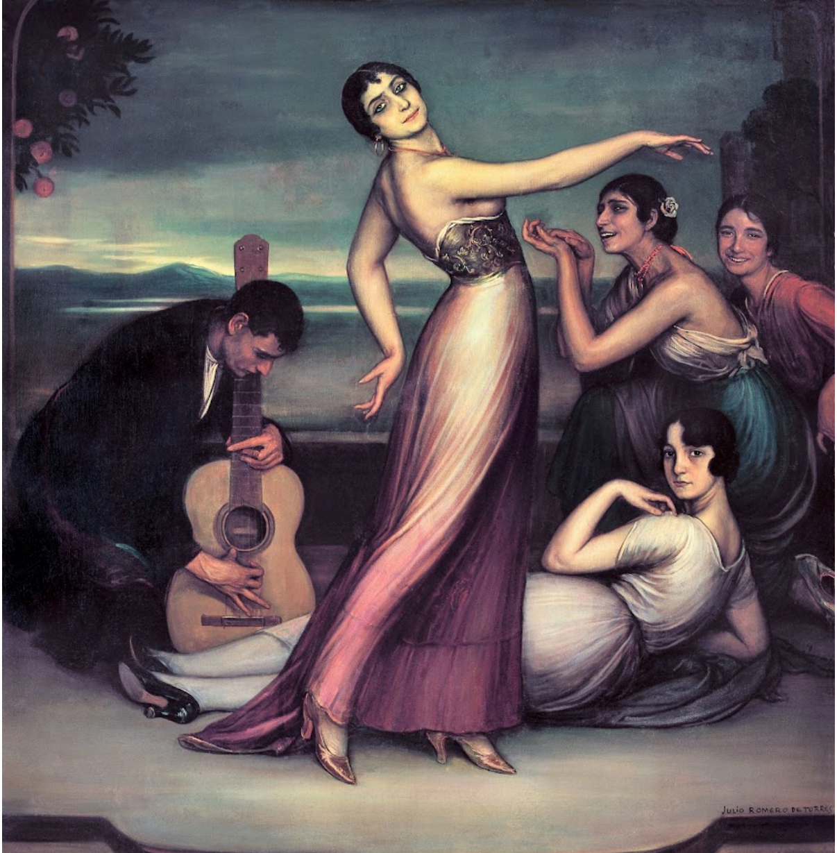
Julio ROMERO de TORRES (pintor español), Alegrías , 1917