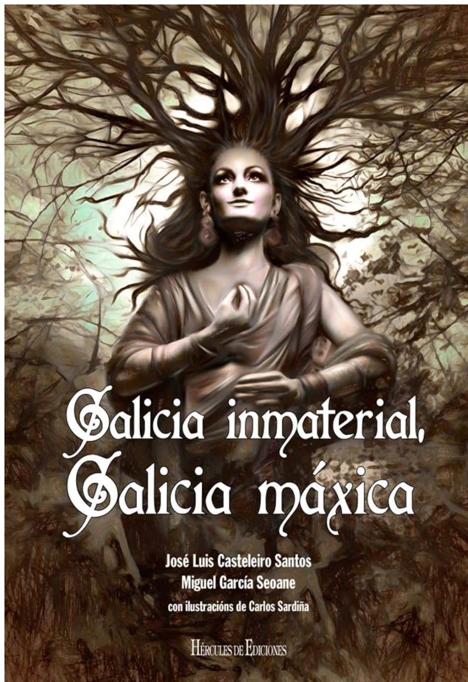
Portada del libro Galicia inmateral, Galicia máxica , 2018