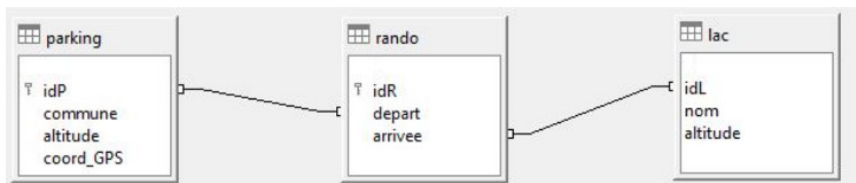
Figure 1. Schéma des trois relations

Elle crée trois relations représentées sur le schéma ci-dessous (figure 1).