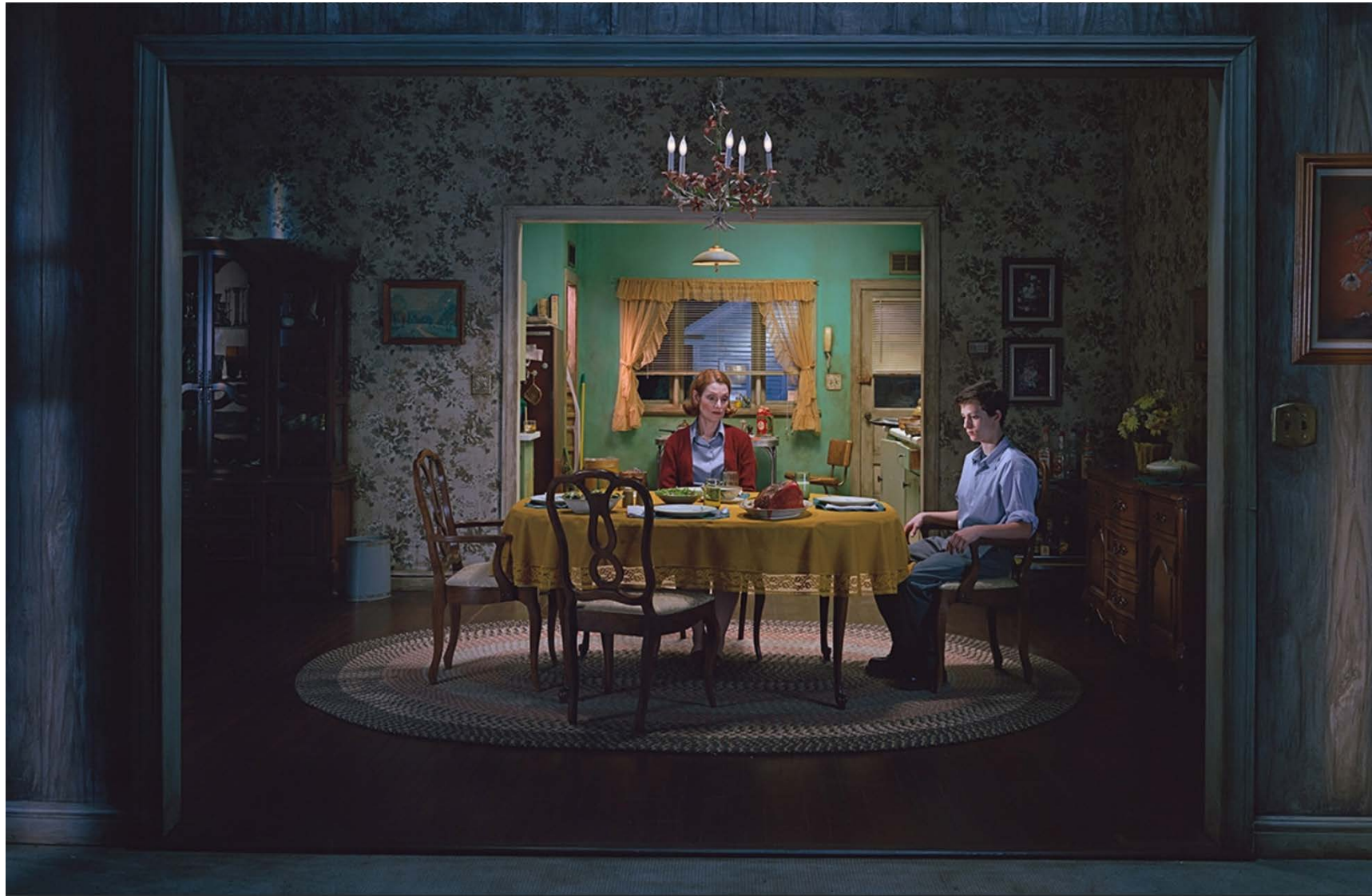
Gregory Crewdson, Untitled (Sunday Roast) (Sans titre [Le rôti du Dimanche]), de la série : Beneath the Roses (Sous les roses), 2003-2008, impression digitale, 144,8 x 223,5 cm. ALBERTINA Museum (Musée Albertina), Vienne, Autriche.